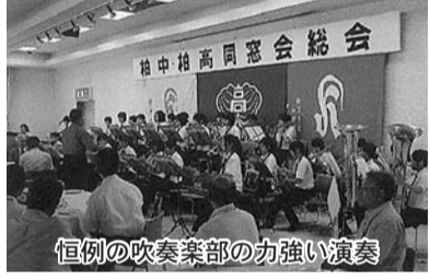
恒例の吹奏楽部の力強い演奏