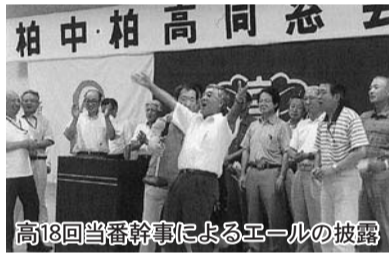
高18回当番幹事によるエールの披露