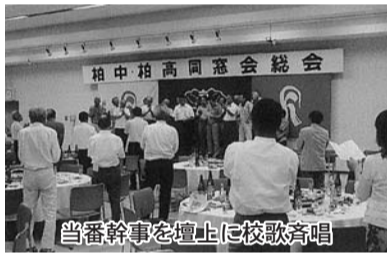
当番幹事を壇上に校歌斉唱