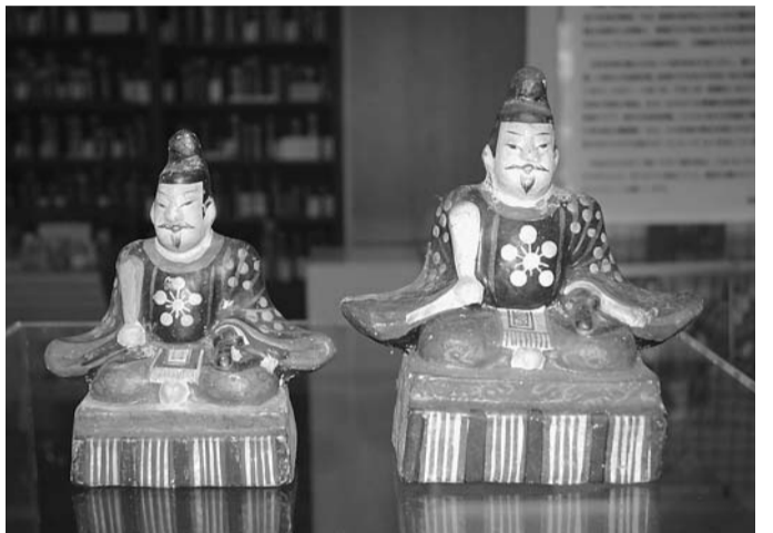
天神様は柏崎地域に数多く残る