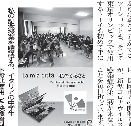
私の記憶を語る、イタリアの中学生 下段は使用した映像資料