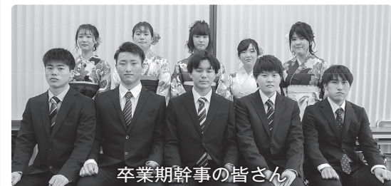
卒業期幹事の皆さん

昨年引き続き今年も新型コロナウイルス感染防止のため卒業生同窓会入会式は中止となりました。第74回卒業期幹事の皆さんは、同窓会長からお祝いの言葉、事務局からは幹事の役割等の説明を行いました。